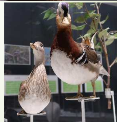
生田緑地ギャラリー 70