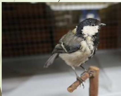
生田緑地ギャラリー 03