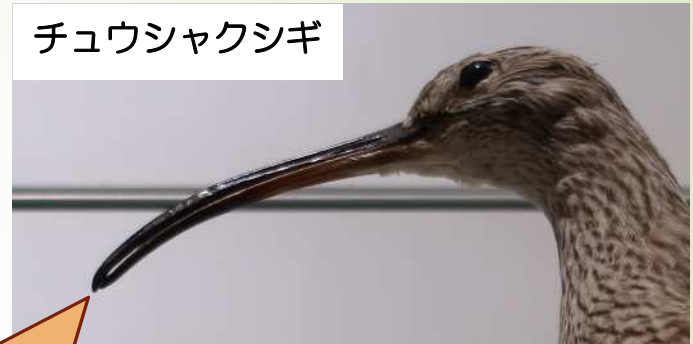
チュウシャクシギ

ま なが 曲がった長い ふか くちばしで深い どろ なか えもの 泥の中の獲物を ひ ば だ 引っ張り出す。