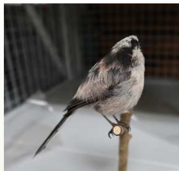
生田緑地ギャラリー 11