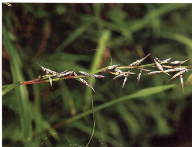
オガルカヤ(イネ科) (吉田)