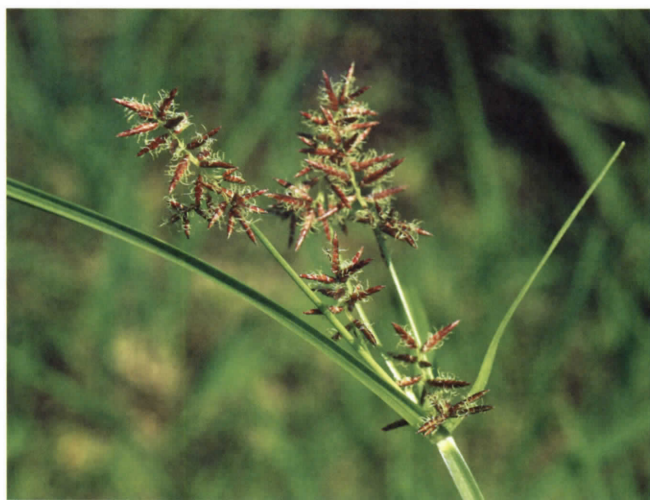
ミズガヤツリ(カヤツリグサ科) (吉田)