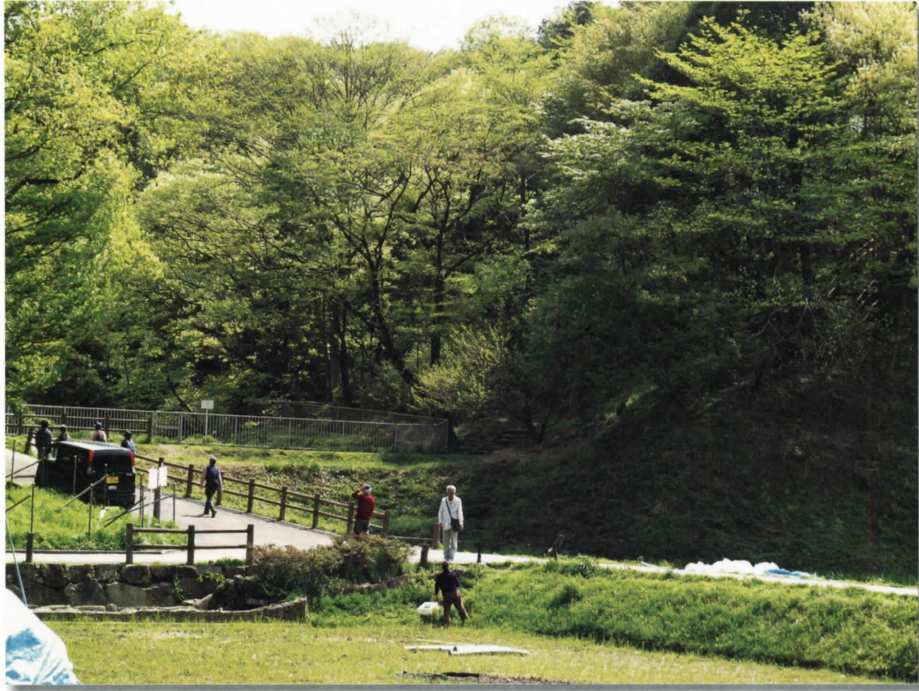
調査地(寺家)の景観