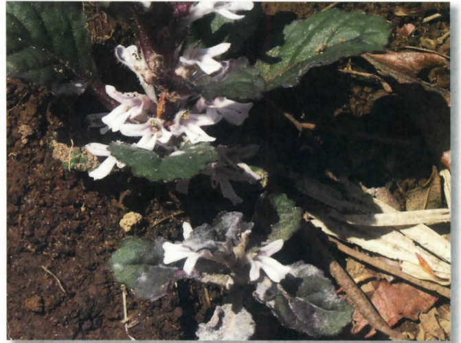
ツクバキンモンソウ(シソ科)