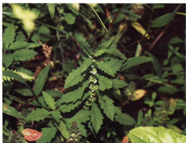
コシロネ(シソ科) (吉田)