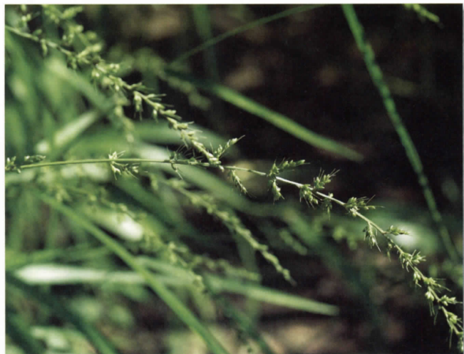
イヌアワ(イネ科) (吉田)