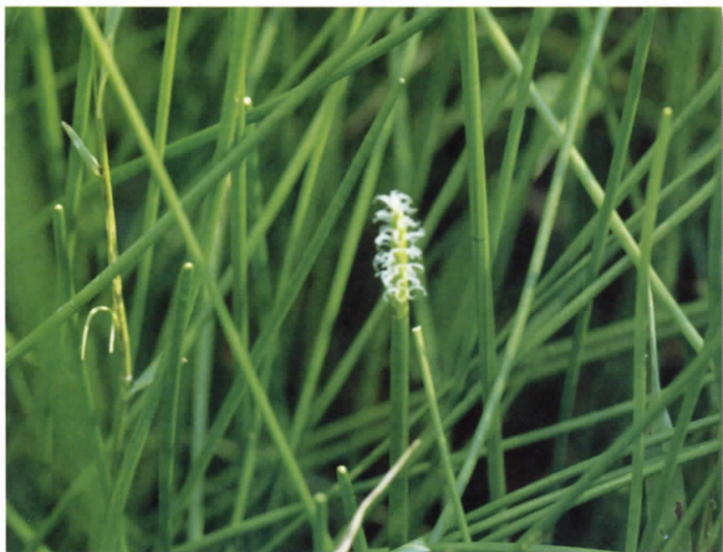
クログワイ(カヤツリグサ科) (吉田)