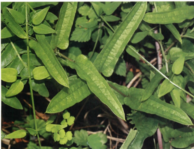
ホソバシオデ(ユリ科) (吉田)