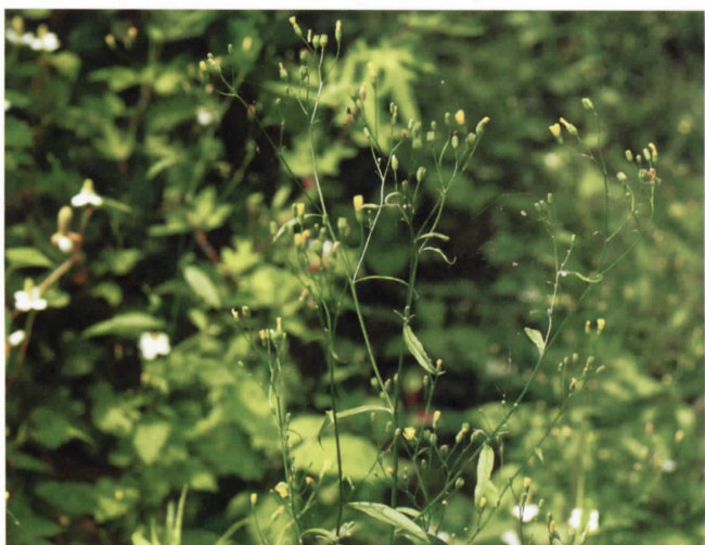
ナタネタビラコ(キク科) (吉田)