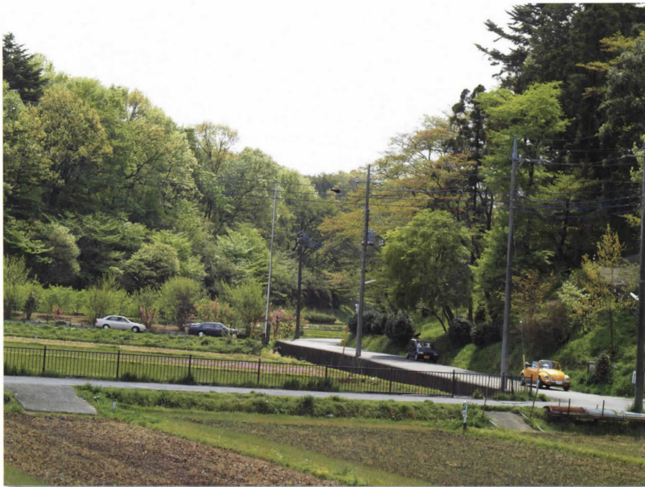
調査地(寺家)の景観