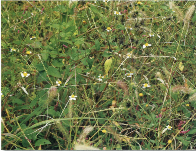
コシロノセンダングサ(キク科) 帰化植物 (吉田)