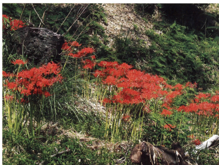
ヒガンバナ(ヒガンバナ科) (吉田)