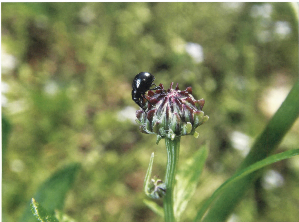
キツネアザミ花上のアザミホソクチゾウムシ(川崎市麻生区) (雑倉)