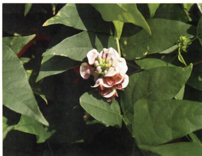
アメリカホド(マメ科) 帰化植物 (吉田)