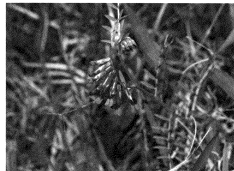
ナヨクサフジ (フジ科) 2006.5.10