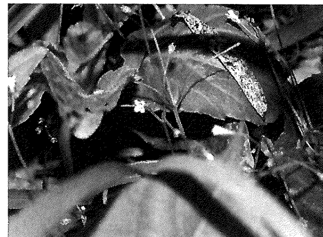
アイナエ (マチン科) 2006.9.15