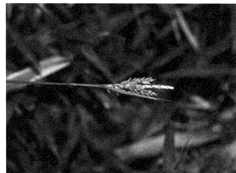
モエギスゲ (カヤツリグサ科) 2006.5.1