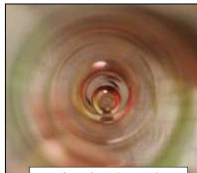
ビー玉スティック

玉の形はまるいかたち。ビー玉・水玉・玉子に・・・ほかにもあるかな？ 転がしたり、落としたり、どうやってあそぶ？ ころころビー玉スティックを作ったのぞこう！ 水中シャボン玉チャレンジ！など・・・。